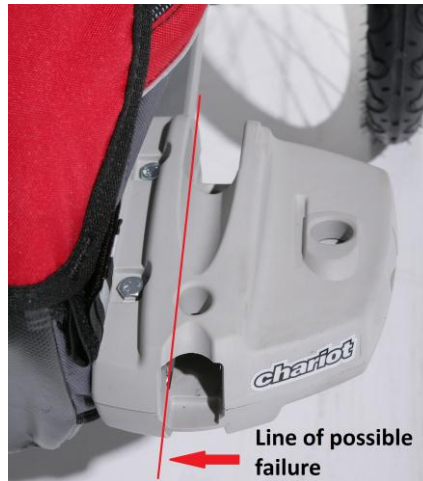
Linie mit möglichen Fehlerstellen

VersaWings 2.0 an Carriern, die zwischen Dezember 2005 und Juli 2010 hergestellt worden sind, können im seltenen Fall eines Überrollens brechen